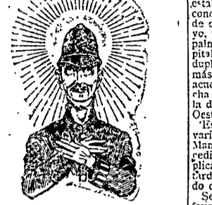
Portrait of a man, likely a senator or official mentioned in the text.